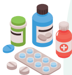
5. Medicamente expirate