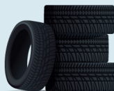
3. Anvelope uzate și vehicule scoase din uz