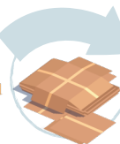
Pliați sau turtiți