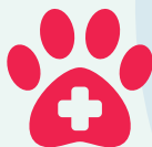
6. Deșeuri veterinare și cadavre de animale