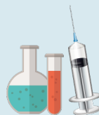
4. Deșeuri medicale