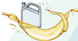
2. Ulei de motor sau orice alt tip de ulei uzat alimentar și nealimentar