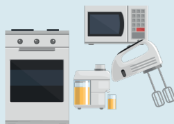
7. Deșeuri de echipamente electrice și electronice (DEEE)