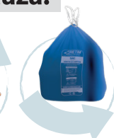
Depozitați-le în sacul corespunzător